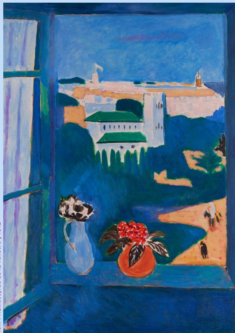
Henri Matisse, Vue de la fenêtre , 1912