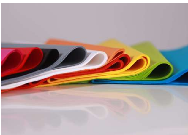
Papier de soie

Vous pouvez apporter des livres ou du papier déjà utilisés à la déchetterie qui va les amener dans une usine à papier.