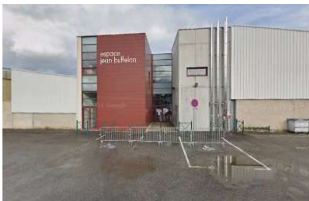
Espace Jean Buffelan

Tu peux te renseigner au service des sports de la mairie !