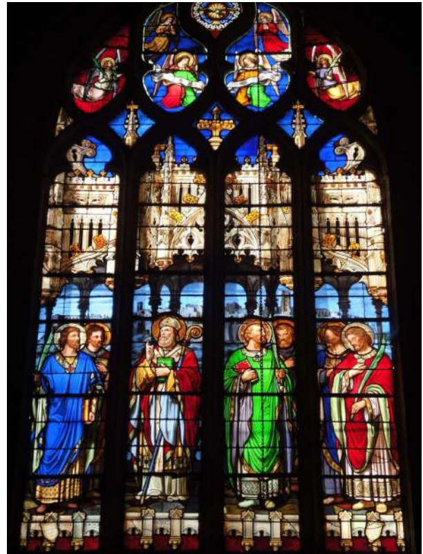
Vitrail représentant les 4 prédicateurs Girons, Sever, Clair, Justin

Un petit oratoire est bâti à cet endroit, autour duquel la ville de Saint-Girons va se développer.