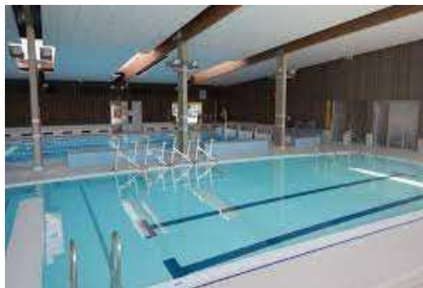
Centre aquatique du Couserans