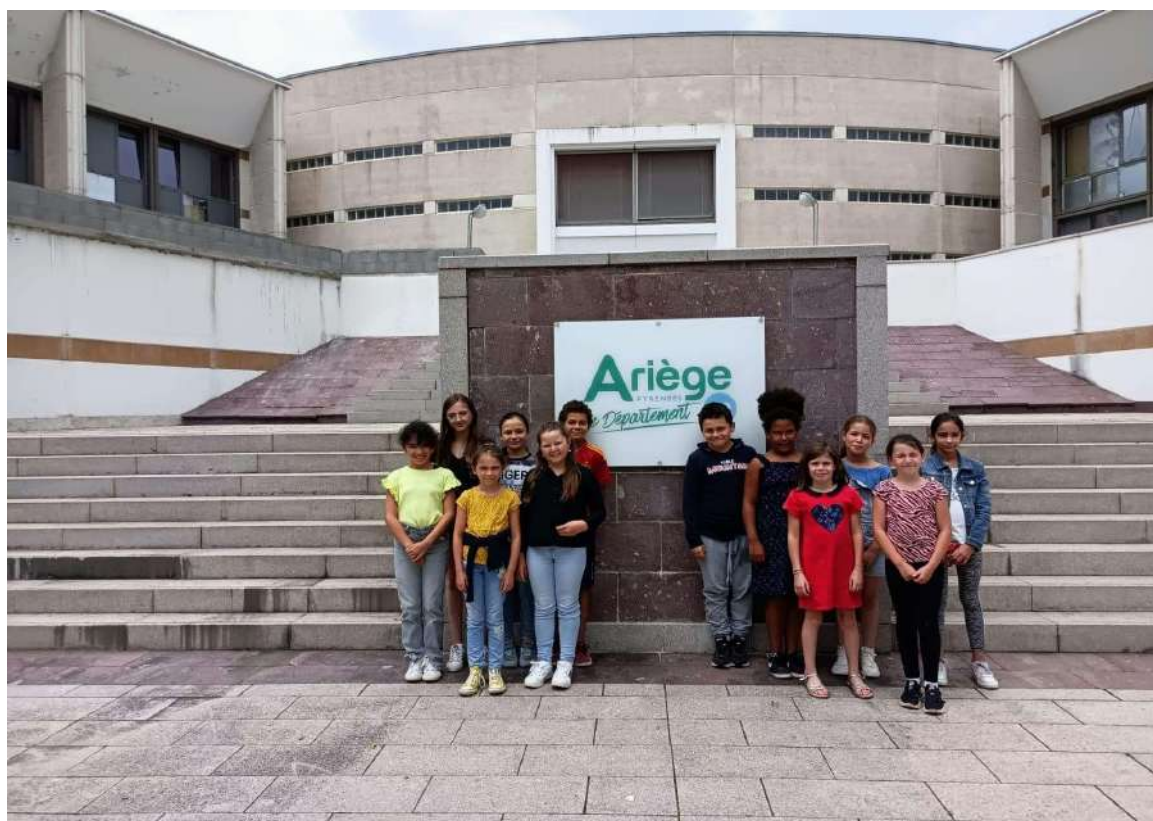
Visite du Conseil Départemental le 22/06/2022