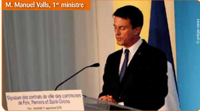
M. Manuel Valls, 1 er ministre

« Un véritable projet de société pour Saint-Girons » : c'est ainsi que François Murillo a qualifié le Contrat de Ville le 11 septembre dernier, lors de son allocution en présence du Premier ministre Manuel Valls. Rappelons que l'Etat, en 2014, a défini, dans le centre de Saint-Girons, un quartier « Cœur de ville » dit « quartier prioritaire » au regard de la politique de la ville. La délimitation a été effectuée par l'Etat en prenant en compte les ressources des populations du quartier, inférieures au seuil de pauvreté défini par l'INSEE.