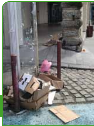
Cartons parasités par d'autres déchets place Pasteur

Le Sictom du Couserans a mis en place une collecte des cartons dans l'hyper-centre de Saint-Girons. Des containers à cartons seront prochainement mis en place en ville. Retrouvez tous les renseignements utiles sur le site www.sictom-couserans.fr ainsi que sur la brochure dédiée.