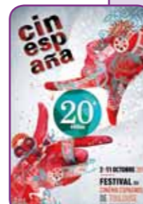
>> Festival Cinespaña au Cinéma municipal Max Linder