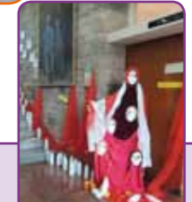
>> Lutte contre les violences faites aux femmes - Journée de sensibilisation organisée par le CISP de Saint-Girons avec exposition et ateliers à l'Hôtel de Ville et soirée ciné-débat - salle Max Linder