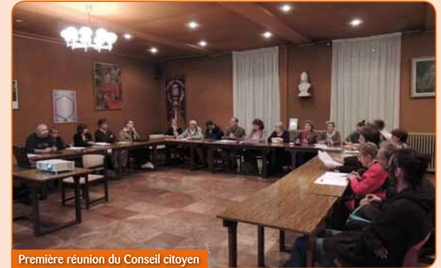
Première réunion du Conseil citoyen

A Saint-Girons, le Conseil citoyen s'est réuni le 24 novembre et a décidé de nommer des représentants qui participeront aux instances de pilotage du Contrat de Ville, de façon à être tenus informés de l'évolution des affaires municipales et faire