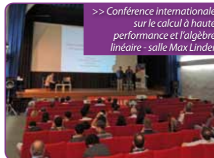
>> Conférence internationale sur le calcul à haute performance et l'algèbre linéaire - salle Max Linder