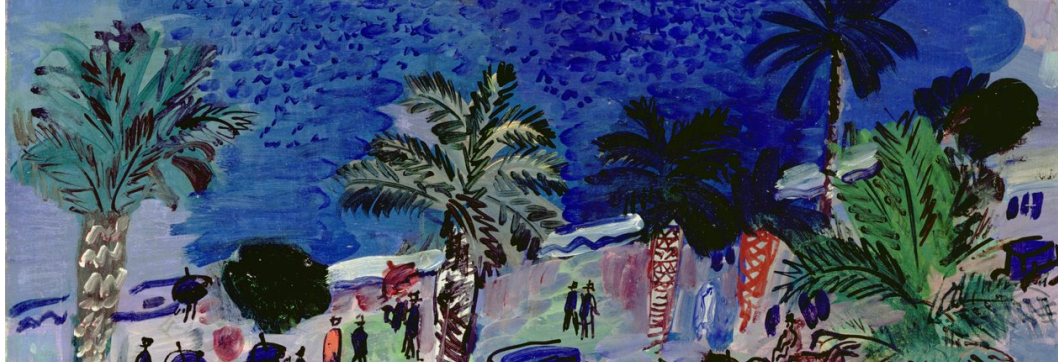
Raoul Dufy, La baie des anges , Nice, 1927.

15h30: “Kandinsky : voir la musique, réinventer la peinture” Comment la musique a profondément inspiré et infusé l’œuvre de Vassily Kandinsky, pionnier de l’abstraction. Une exploration sensible de l’univers du peintre avant-gardiste, considéré comme l’un des artistes phares du XXe siècle.