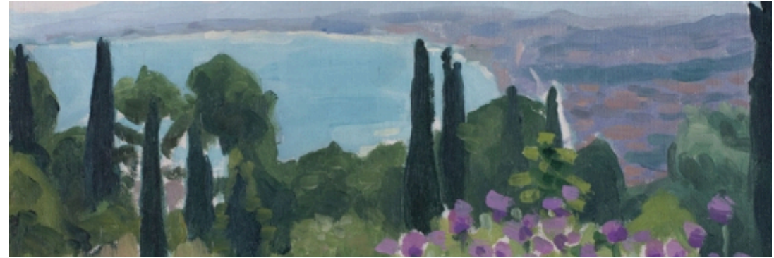
Albert Marquet, La Baie d’Alger , 1921.

15h30: “El'sardines”. Près d’Oran. A 6 jours du mariage de sa soeur, Zouzou, ingénieure bio-maritime 30 ans et célibataire, n’arrive pas à annoncer à sa famille qu’elle part le lendemain des noces suivre la course des sardines qui ont mystérieusement déserté les eaux algériennes. Entre médisances sur son célibat, séances chez une psy coiffeuse et amitié en crise, Zouzou partira-t-elle ?