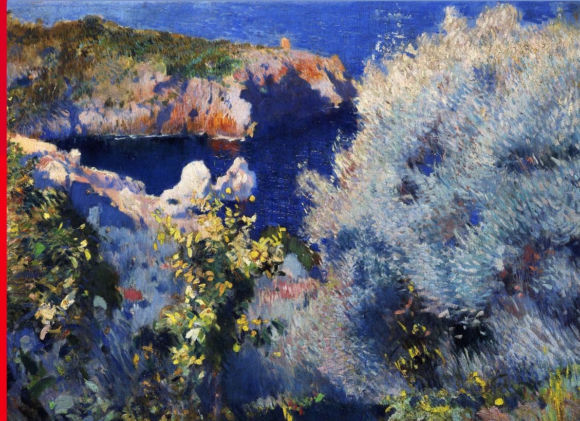
Joachim Mir, Landscape of Mallorca , 1901.