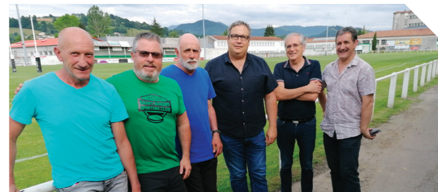
L'encadrement de l'Entente Rugby Couserans et les Adjointes au stade Léopold Gouiric

Nous nous réjouissons du retour de l'Ovalie saint-gironnaise dans LA catégorie qui fut la sienne à plusieurs reprises par le passé et fait équipe avec son club pour assurer une logistique à la hauteur de la qualification. La fabuleuse montée vers l'échelon supérieur qui fait la belle actualité du SGSC lui impose aussi des obligations, en termes de nombre de licenciés (jeunes, féminines, arbitres, éducateurs formés, dirigeants) comme d'installations. Des données que