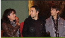
Basket-ball: l'équipe sénior