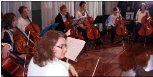
L'ensemble de violoncelles