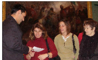
Des nouveaux venus ! Le rugby féminin, le football féminin, et la « Gym détente enfants »